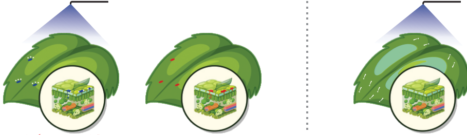
پروکسانل کے اسپرے سے بیماری پر کنٹرول اور اسپورز بننے کا عمل ختم

پروکسانل اپنے دوہرے طریقہ اثر کی بدولت آلو کے پچھینا جھلساؤ کا مؤثر حفاظتی اور معالجاتی کنٹرول فراہم کرتا ہے۔ یہ اپنی تیز سرایت پذیری اور