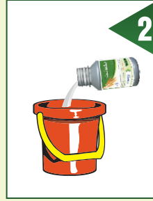
اس میں سلفونیت 150 ملی لیٹر ڈالیں