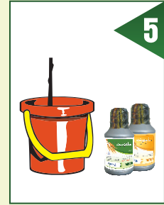
اس طرح تقریباً 8 گم محلول تیار ہو جائے گا