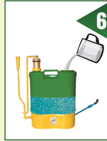
اسپرے مشین کے ٹینک کو آدھا پانی سے بھر لیں اور اس میں ایک گم تیار شدہ محلول ڈالیں