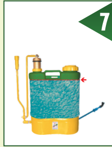
بقیہ ٹینک کو پانی سے بھر دیں اور ایک کنال رقبہ پر اسپرے کریں