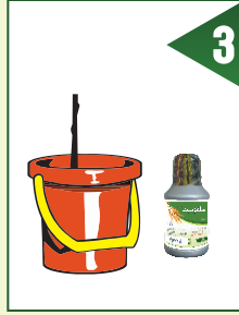
اگے بعد کڑی سے اچھی طرح حل کریں