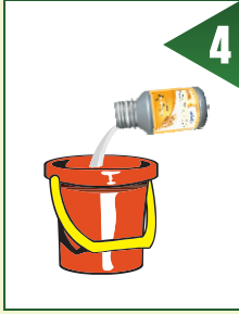
اب ایڈجیونٹ 150 ملی لیٹر ڈال کر اچھی طرح ملائیں