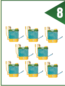
11 ایکریلکے 8 مشینیں لگانی ہیں