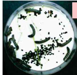
غیر اسپرے شدہ