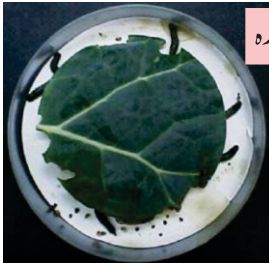
تا کومی سے اسپرے شدہ

تا کومی کپاس، گوبھی، پھول گوبھی اور ٹماٹر میں نہایت کامیابی سے استعمال